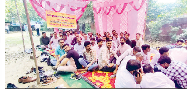
सोनीपत। धरने के दौरान मौजूद पटवारी, कानूनगो एवं अन्य।