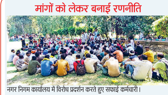
नगर निगम कार्यालय में विरोध प्रदर्शन करते हुए सफाई कर्मचारी।