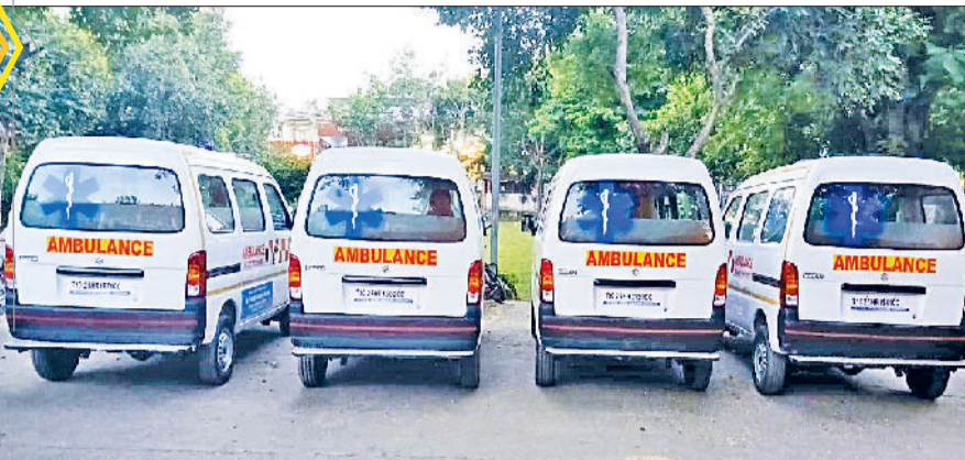
सोनीपत। परिसर में खड़ी एंबुलेंस गाड़ियां।

वाहनों की मरम्मत करवाना भी स्वास्थ्य विभाग के लिए चुनौती