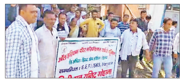
गोहाना। एसडीओ के खिलाफ प्रदर्शन करते कर्मचारी।