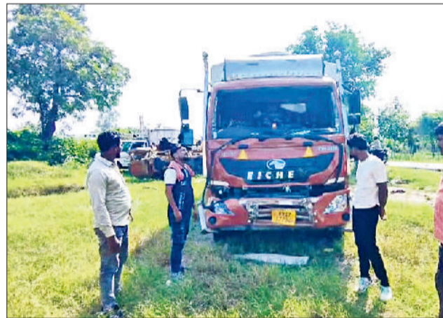
सोनीपत। हादसे में क्षतिग्रस्त कैंटर व मृतकों के परिजन।

राष्ट्रीय राजमार्ग संख्या-334बी पर बुधवार रात हुए दर्दनाक सड़क हादसे में दो किसानों की मौत हो गई, जबकि पांच अन्य गंभीर रूप से घायल हो गए। हादसा उस समय हुआ जब सब्जी से भरी एक पिकअप वैन को पीछे से तेज रफ्तार कैंटर ने टक्कर मार दी। सभी किसान उत्तर प्रदेश के बागपत जिले के रहने वाले थे और सब्जी बेचने के लिए दिल्ली की आजादपुर मंडी जा रहे थे। टक्कर के बाद कैंटर चालक वाहन छोड़कर मौके से फरार हो गया। सूचना के बाद मौके पर पहुंची पुलिस ने शवों को कब्जे में लेकर नागरिक अस्पताल में भिजवाया। जहां शवों को पोस्टमार्टम करवाकर परिजनों को सुपुर्द कर दिया। पुलिस मामले की गंभीरता से जांच कर