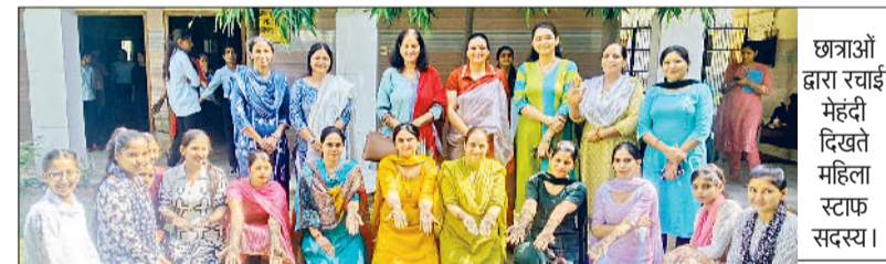
छात्राओं द्वारा रचाई मेहंदी दिखते महिला स्टाफ सदस्य।