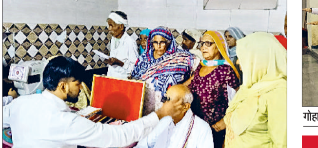
खरखोदा। रोगियों की आंखों की जांच करते नेत्र चिकित्सक।