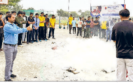
सोनीपत। पूर्ण मूर्ति कैम्पस में सुरक्षा उपकरणों के बारे में जानकारी देते हुए।