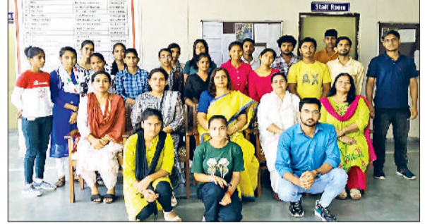
खरखोदा। शिक्षकों के साथ प्रतियोगिता के प्रतिभागी विद्यार्थी।